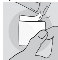
Rysunek 1: Otwieranie saszetki

Przed użyciem chusteczki należy dokładnie umyć ręce. Rozearwać saszetkę, aby ją otworzyć (Rysunek 1) i rozłożyć znajdującą się w środku chusteczkę. Nie używać żadnych narzędzi do otwierania saszetki.