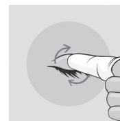
Rysunek 2: Oczyszczanie powiek i rzęs

Delikatnie masować powieki małymi, kolistymi ruchami, usuwając wszelkie zanieczyszczenia, wydzielinę lub kosmetyki.